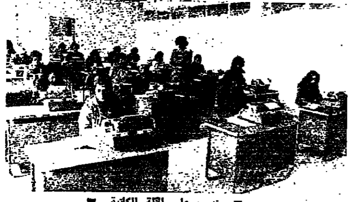
تدريب على الآلة الكاتبة

صيدا - من مراسل «الانوار» : بلدية صيدا كانت سياقة في التحاويج الزناه الذي وجهه وزير المال الى الدوائر الرسمية ، ولوضع موازنه تفصيليه وشذ احزمة . وقد انتهت من مشروع موازنه عام ١٩٧٧ ، عملا بآلان الشامي « على قد بساطك مد رجليك » . وفي مؤتمره صحفي عقد في السراي ، تحدث المحافظ هليم نياض ، بصفته المسؤول المباشر عن بلديه صيدا ، عن التفات الادارية للمشروع . وقال : لقد حاولنا قدر المستطاع ضغط التفات الادارية في الموازنه ، وزيادة الاعتمادات المخصصه للمشاريع التنموية . وبالمقارنة مع موازنه عام ١٩٧٦ ، يتضح ما يلي : بالنسبة للرواتب والاجور كانت موازنه عام ١٩٧٦ ١٩٧٦ و١٩٧٦ و ٢٢٩ الف ليرة ، فاصبحت ومشروع موازنه عام ١٩٧٧ مليوناً و ٨٢٢ الفاً و ٧٠٠ ليرة لبنانية اي بنصف مقدار ٢٦٦ الفاً و ٢٢٠ ليرة لبنانية وكذلك التفات الادارية التي كانت ١٩٧٦ ٢١٢ الف ليرة ، فخفضت الى ٢٦٦ الف ليرة اي مبلغ ٥٠ الف ليرة . وبالنسبة للمشاريع التنموية قال المحافظ نياض ان اعتماداتها ارتفعت من ١٢ بالمائة من مجمل موازنه عام ٧٦ الى ٢٥ بالمائة من مجمل موازنه عام ١٩٧٧ ، اي ان مجمل نفقات التجهيز والاتشاء الذي كان في موازنه عام ١٩٧٦ ٢٢٤ الف ليرة ، اصبح في موازنه عام ١٩٧٧ مليوناً و ٨٢ الف ليرة ، اي بزيادة ٦٤٨ الف ليرة . وقال المحافظ : احتجنا في الموازنه الجديدة على زيادة القيمة التجارية والاجور من اجل ان نرفع قيمة المشاريع التنموية . وبالنسبة للقيمة التجارية التي كانت في موازنه ١٩٧٦ حوالي ٤٨ الف ليرة ارتفعت في الموازنه الجديدة الى ٦٠٠ الف ليرة اي بزيادة ١١٥ الف ليرة ، ورخص البناء وارتفاعها من ٦٥ الف ليرة في موازنه ١٩٧٦ الى ٧٠٠ الف ليرة ، اي بزيادة ٥٠ الف ليرة .